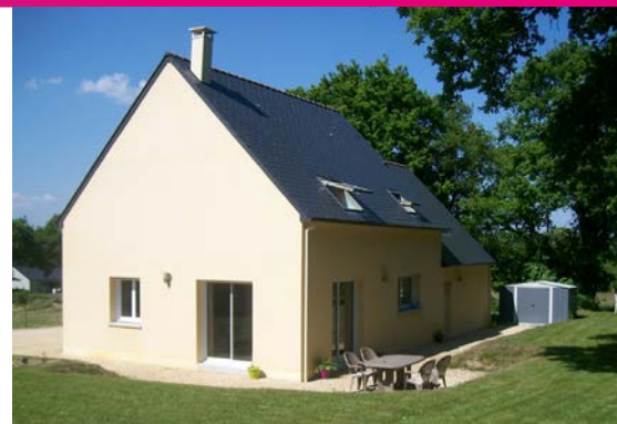
Laissez des signes visibles de présence même pour une courte durée