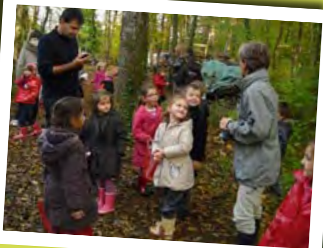
Sortie des maternelles