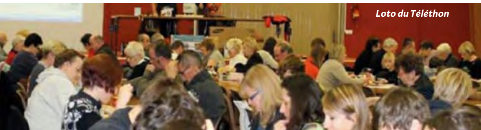
Loto du Téléthon

sentation des gens de Velaine et des écoles. L'APRV remercie tous les organisateurs, partenaires et bénévoles qui ont apporté leur contribution à cette grande manifestation et leur donne rendez-vous à l'année prochaine.