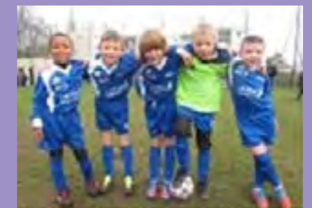
6 enfants de 7 et 8 ans : les U8/U9

Les entrainements se déroulent sur le stade municipal le mercredi à 16 h 30 et les rencontres (sous forme de plateau avec une quinzaine d'équipes présentes) se tiennent le samedi matin. Les équipes sont composées de 5 joueurs (4 joueurs + 1 gardien). Les durées de match vont de 12 minutes (pour les petits U6/U7) à 20 minutes pour les plus grands (U8/U9).