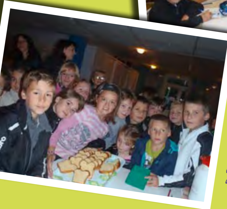
Brioche de l'amitié