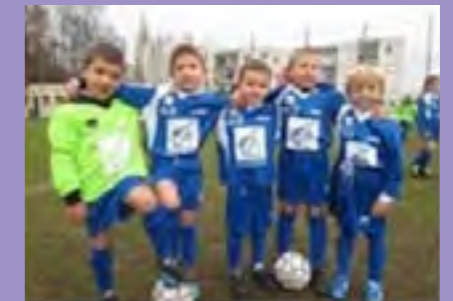
7 enfants de 5 et 6 ans : les U6/U7

Il faut savoir que tous les enfants qui ont pris leur licence, pour la saison 2012/2013, n'étaient pas licenciés ailleurs. Nous allons, pour info, en récupérer quelques-uns de Villey mais aussi de Gondreville. En effet, les parents ont préféré